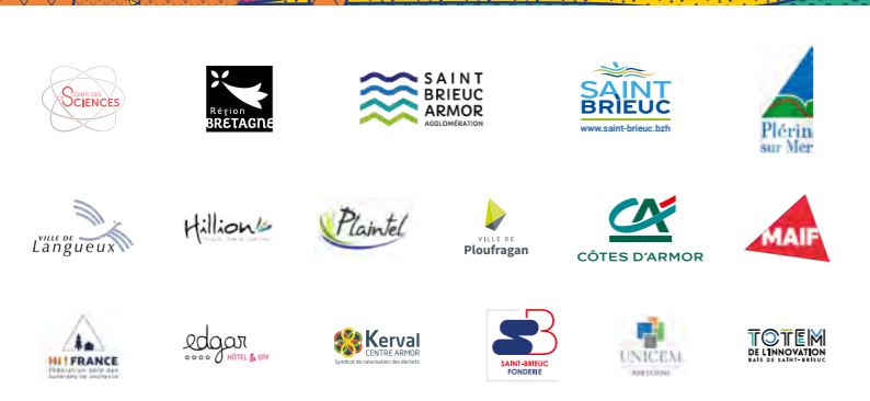
Illustration et graphisme : Mathieu Bourdeille